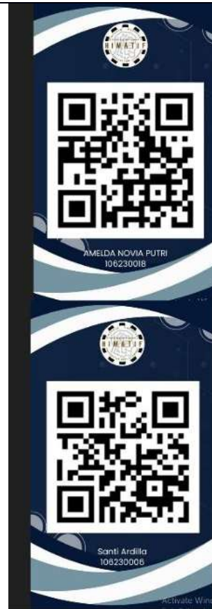
Gambar 5 tampilan Id Card Mahasiswa

Spreadsheet ini merupakan hasil otomatisasi absensi berbasis pemindaian barcode atau QR Code yang mencatat nama dan NIM peserta, tanggal, waktu, serta status kehadiran (seperti Hadir atau Sakit). Data dicatat secara real-time dan konsisten, kemungkinan berasal dari Google Form atau aplikasi pihak ketiga. Adanya teks “Demo - please subscribe to full version” menunjukkan penggunaan aplikasi dalam versi gratis. File ini cocok digunakan untuk merekap dan memantau kehadiranpeserta secara efisien dan akurat.