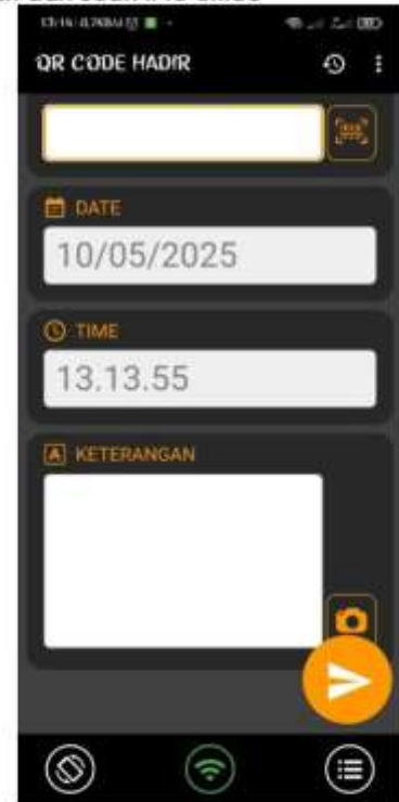
Gambar 4 Tampilan scan it to office

Aplikasi "Scan it to Office" adalah alat bantu modern dalam sistem absensi digital, yang memungkinkan mahasiswa mencatat kehadiran secara praktis, cepat, dan akurat hanya dengan memindai QR code yang telah disiapkan dosen. Fitur-Fitur pada Tampilan Aplikasi: