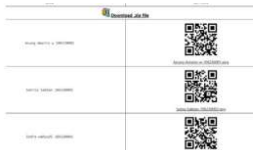
Gambar 3 contoh tampilan barcode mahasiswa

Gambar ini adalah representasi visual dari sistem absensi digital modern berbasis QR Code, yang memungkinkan pencatatan kehadiran Mahasiswa secara efisien, aman, dan terdokumentasi. Masing-masing mahasiswa memiliki kode unik yang menunjukkan eksistensi dan partisipasinya dalam kegiatan akademik tertentu.